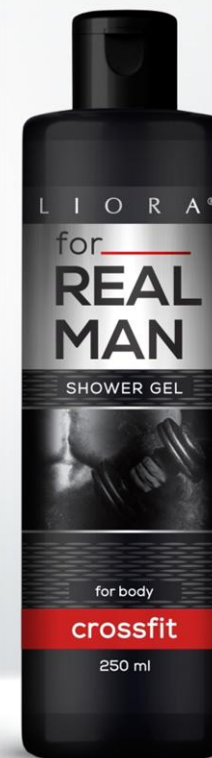
ГЕЛЬ ДЛЯ ДУШУ ДЛЯ ЧОЛОВІКІВ

Тонізуючий гель для душу дарує заряд бадьорості, відчуття чистоти та свіжості, що так необхідно сучасному успішному чоловіку. До його складу входять активні компоненти, які забезпечують щоденний догляд за шкірою, зволожують та попереджують подразнення. М'яка формула гелю легко перетворюється в ніжну піну, м'яко очищує та не сушить шкіру.